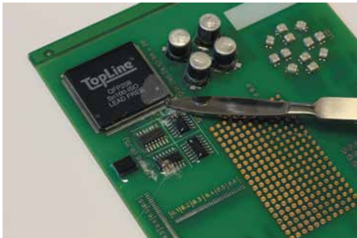
1 Снятие влагозащитного покрытия с помощью скальпеля