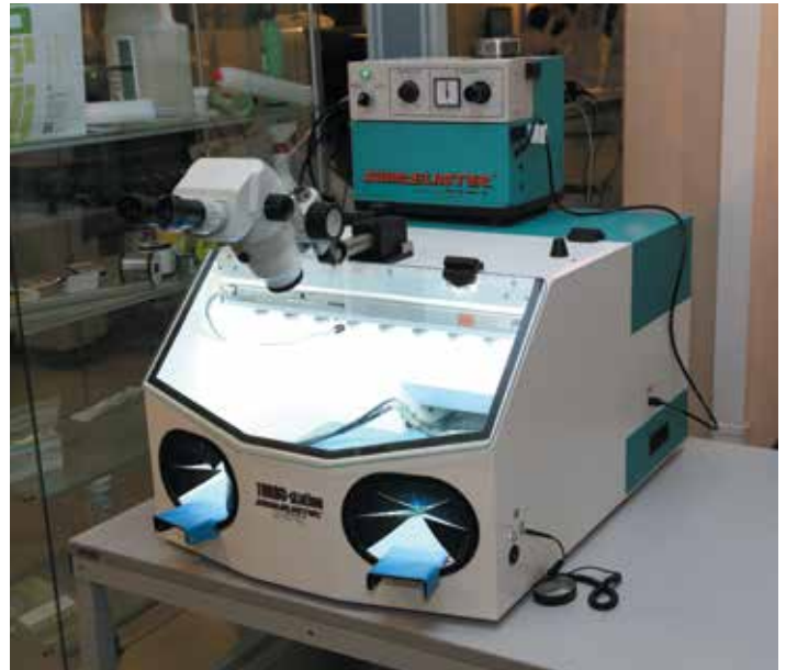
3 Установка для абразивного удаления влагозащитных покрытий Swam Blaster Turbo Max

Swam Blaster Turbo Max состоит из двух блоков: рабочей камеры и блока подачи абразивного потока. Ремонтируемая печатная плата помещается в рабочую камеру,