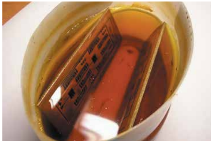
2 Вымачивание печатного узла в растворителе для снятия УР-231