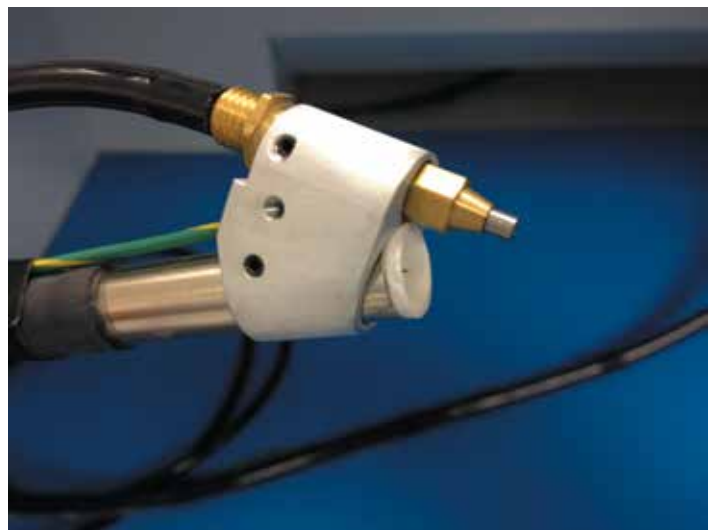
4 Блок наконечника распыления абразива с форсункой и микроионизатором

где находится блок наконечника с форсункой рис 4. Оператор одной рукой берет наконечник, а другой может перемещать печатный узел. Подача абразива осуществляется путем нажатия на ножную педаль. В рабочую камеру встроена ультрафиолетовая подсветка, которая выделяет участки с влагозащитным покрытием (если в материале содержится УФ-индикатор). Удаленные частицы покрытия и абразива непрерывно всасываются в лоток с отходами.